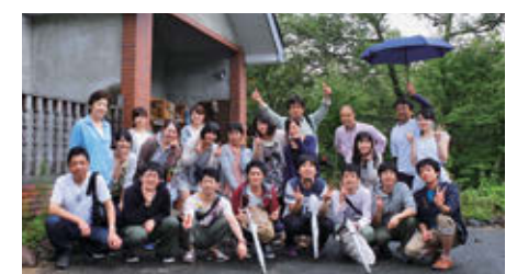
サマーミーティング