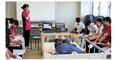
シミュレーションセンター