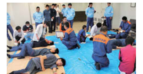
救急隊とのトリアージ訓練