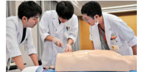
研修医オリエンテーション実習風景