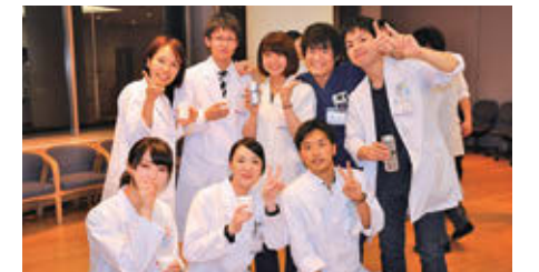
研修医ウェルカムパーティー