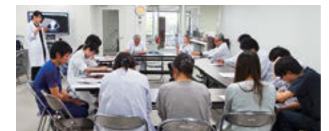
症例カンファレンス