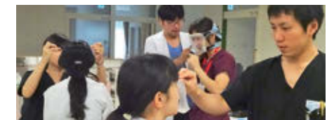
呼吸器ハンズオンセミナー