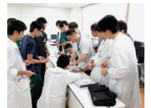
指導医のもと縫合実習