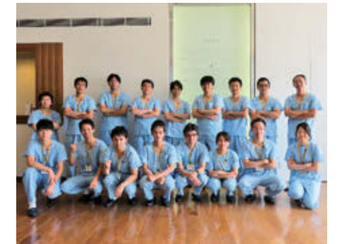
脳卒中サマーセミナーにて