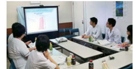
朝のミニ勉強会(毎週火曜日)

TEL : 024-932-6363 FAX : 024-939-3303 E-mail : soumuka2@jusendo.or.jp