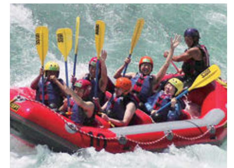
研修医旅行も楽しい思い出!