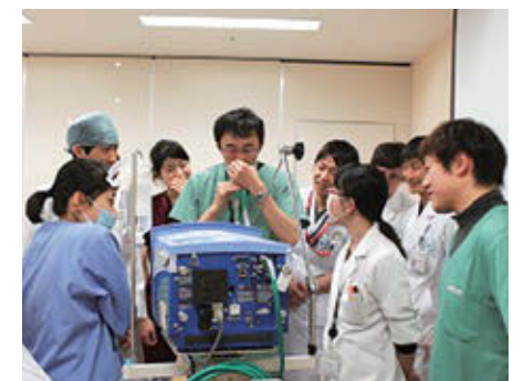
人工呼吸器について(研修医勉強会)