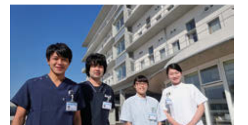
鍼灸研修生と一緒に