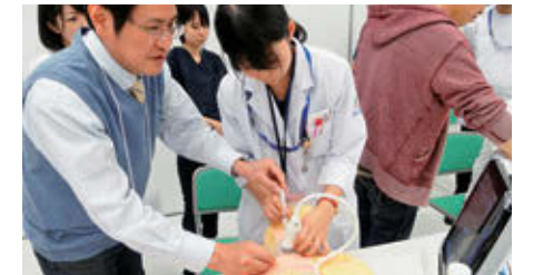
CVC実践セミナー受講風景