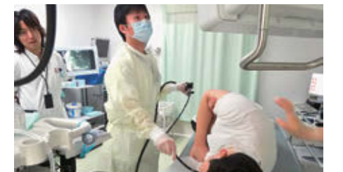
指導医のもと内視鏡中