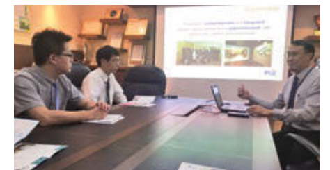
海外研修(シンガポール)