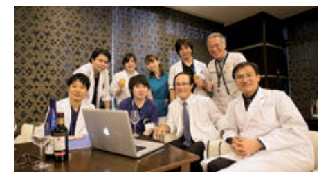
イブニングカンファレンス