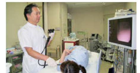
消化器病センター