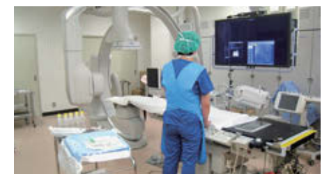
血管連続撮影装置